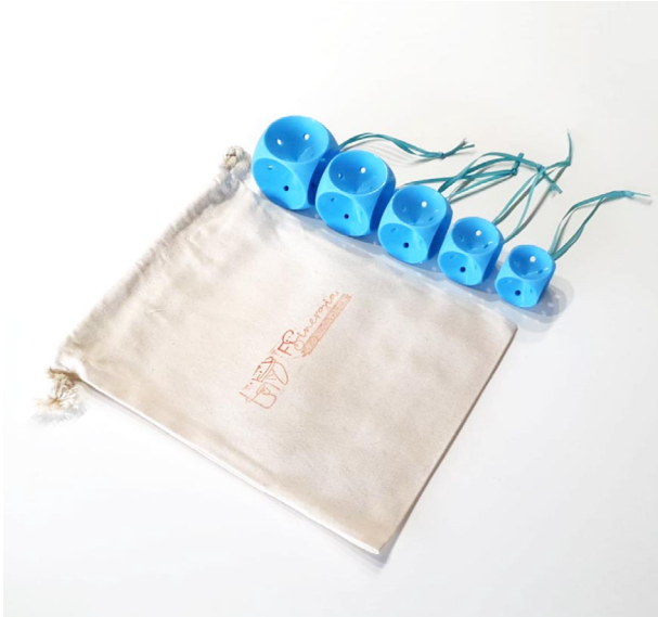
Kit Pesario Cubo $250

DE RESPONDER AFIRMATIVAMENTE ESCRIBES POR INTERNO AL 933067456 PARA REFERIR EL PRECIO DE CADA KIT ADICIONAL.