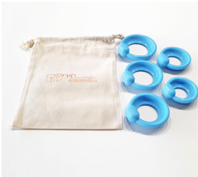
Kit Pesario Plano Uretral $250